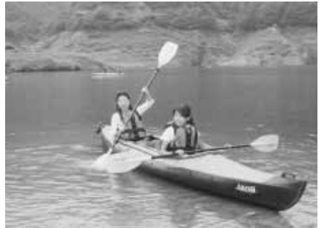
◀ダムまつりでカヌーを楽しむ親子