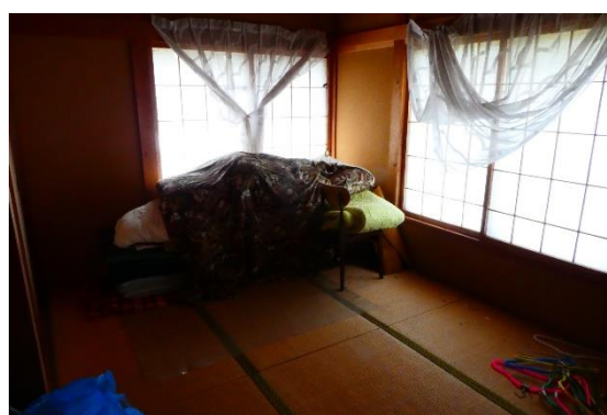
1 階和室 6 畳 (奥)