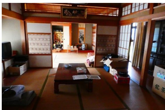
1 階和室 8 畳 + 奥 8 畳