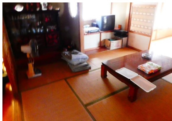
1 階和室 8 畳