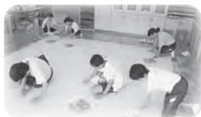
下絵を描くパネル係