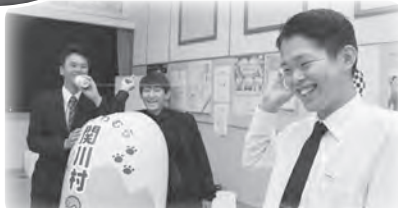
▲糸電話 「気持ちが伝わると、嬉しいね」