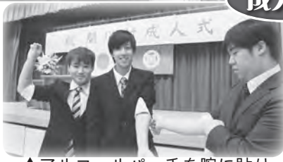
▲アルコールパッチを腕に貼り、 体質を知る新成人