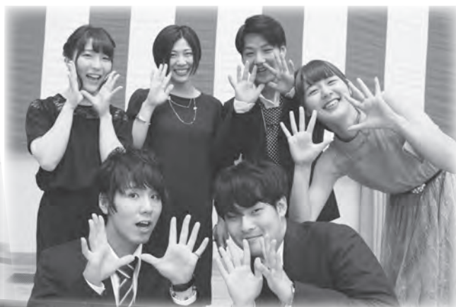
◀実行委員を務めた6人