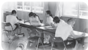
モザイクのピースを確認する 式典実行委員

9月8日(土)、関川中学校体育祭を開催します。7月の結団式からスタートし、夏季休業中も応援リーダーの生徒たち、パネル制作の生徒たちそしてフィナーレを演出する式典実行委員の生徒たちなどが活動をしてきました。夏休みが明け、3年生の応援団長のもと、チームの一体感をつくろうと、毎日、応援練習に力を入れています。当日は「黄軍」「青軍」の2チームが全力で競技・応援する姿をご覧いただき、生徒たちに熱い声援を送っていただきたいと思えます。そして体育祭を締めくくるフィナーレで、生徒・教職員そして観戦いただいた皆さんで、感動と成就感を共有したいと思います。地域の皆様のご支援を、どうぞよろしくお願い致します。