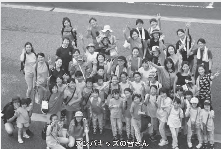
ズンバキッズの皆さん