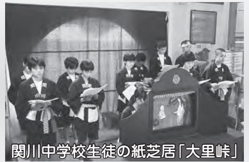
関川中学校生徒の紙芝居「大里峠」