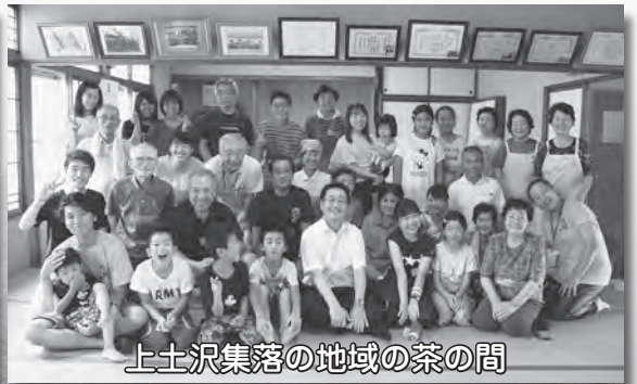
上土沢集落の地域の茶の間