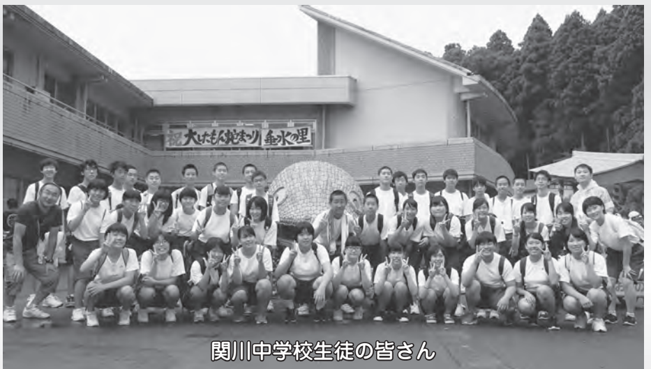
関川中学校生徒の皆さん