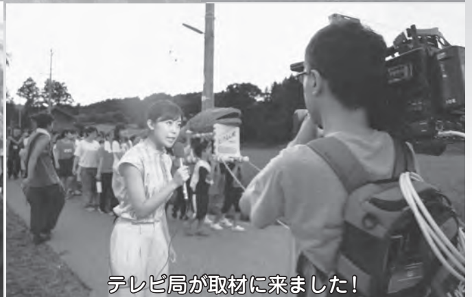
テレビ局が取材に来ました！