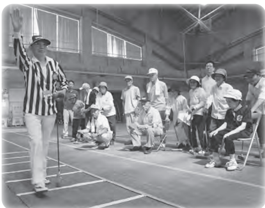
▲村ゲートボール大会での交通安全講習