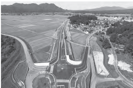
▶ 新国道290号 山本から大島方面を臨む