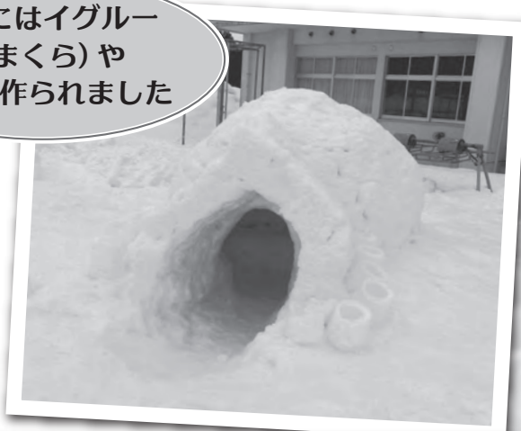
会場にはイグルー (かまくら)や 雪像も作られました