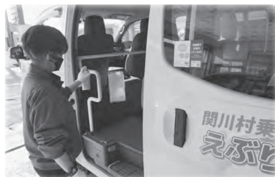
1回の運行ごとに手すりなどを消毒しています。