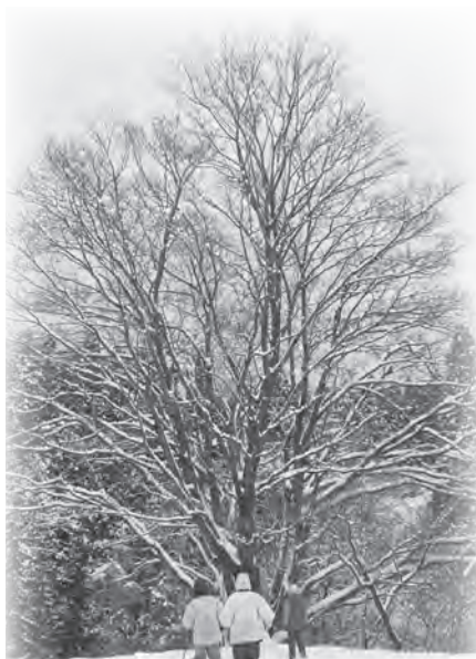
楓の木のメープルサップを採りました