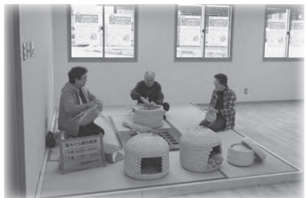
◀観光情報センターの猫ちぐら実演コーナー

ちぐらがリニューアルしたことで、猫ちぐらの製作実演コーナーは、せきかわ観光情報センター内(旧関川村自然管理公社事務室)に移転しました。猫と触れ合えるコーナーを設ける予定もあり、休憩スペースの畳コーナーと併せ