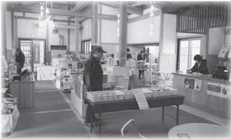
▶リニューアルした「ちぐら」