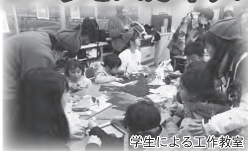
学生による工作教室