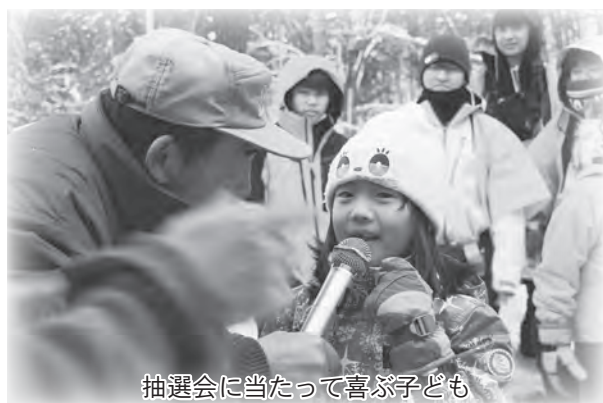
抽選会に当たって喜ぶ子ども