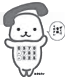
キャンペーンキャラクター「みまもリン」