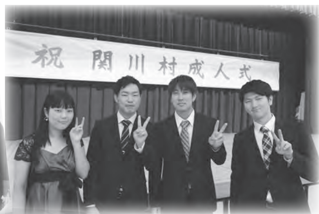
◀ 実行委員を務めた4人