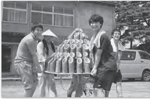
→ 竹灯籠の準備を手伝う 新潟大学の学生