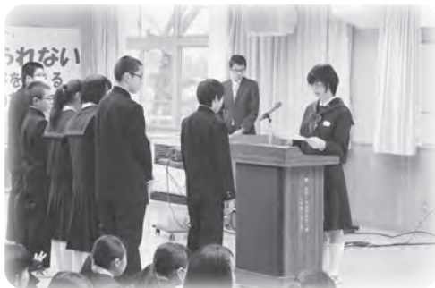
▲会長から委嘱状が渡される