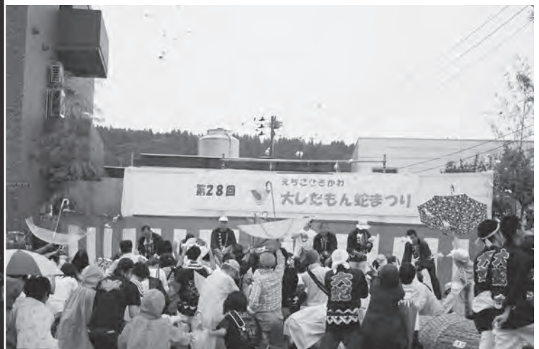
▲まつりのフィナーレには恒例の福まきが行われました。その後、大蛇のお祓いが行われ、今年のまつりが締めくくられました。