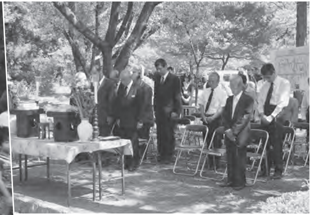
▲羽越水害殉難者供養祭