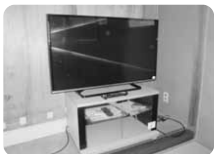
▲テレビ(就業改善センター)