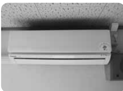
▲エアコン(就業改善センター)

下関コミュニティでは、宝くじの助成を受けて活動備品を整備しました。テント(コミュニティシェルター)とベンチを三つ葉公園に設置したほか、就業改善センターに折りたたみ座卓、エアコン、テレビを備え付けました。宝くじの助成は、一般財団法人自治総合センターが行っている宝くじの社会貢献広報事業。地域社会の健全な発展と住民の福祉向上を目的にさまざまなコミュニティ活動を助成しているものです。