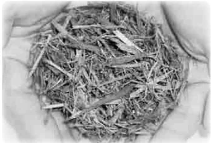
▲チップ化した木材