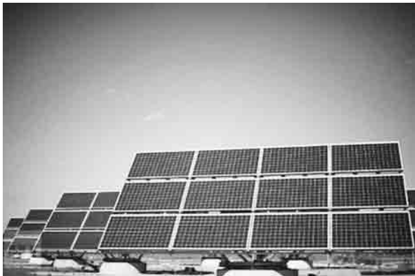
▲太陽光パネル（写真はイメージ）

村では、発電事業者によるメガソーラーの誘致を検討しています。村内に発電用パネルを設置し、太陽光を利用した事業も計画しています。