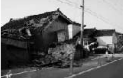
(写真上：新潟県中越沖地震被害の状況)

村では、県建築士会岩船支部と協力して、住宅の耐震診断費用の補助制度を行っています。この制度で耐震診断をした場合は、自己負担1万円で住宅の耐震診断ができます。