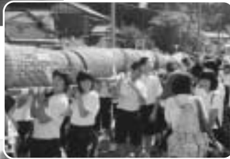
大したもん蛇まつりへの参加