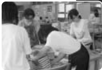
図書館の蔵書整理ボランティア

このほか、夏休み学習会の講師や校地整備作業、登下校の安全指導などでボランティアをお願いします。