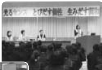
地域の方を講師に「いのちの講演会」