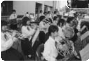
堀と柳の春まつりで吹奏楽部の演奏