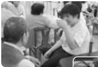
福祉施設での活動