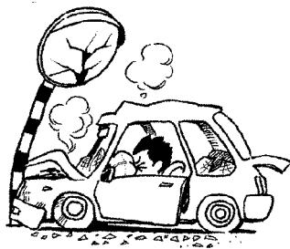
交通事故(人身)の状況 (平成23年1月1日～8月24日)

また、村内の方が村外へ出かけ、交通事故に遭うといったケースも増えています。これから行楽シーズン本番を迎えますが、交通事故に遭わないよう気をつけましょう。