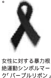
女性に対する暴力根絶運動シンボルマーク「パープルリボン」

だれにも相談できず、ひとりで悩んでいませんか。相談してみると、ひとりでは気づかなかった解決方法が見つかるかもしれません。ひとりで悩まず、まずはご相談ください。