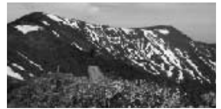
不忘山から屏風岳を望む 問い合わせ 村民会館 ☎64-2134