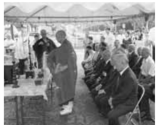
交通安全祈願祭のようす

九月二十一日、秋の交通安全運動にあわせ、交通安全協会関川支部主催の「安全祈願祭」が打上の交通安全地蔵尊で行われました。当日は、関係者や地元住民など約百人が出席。交通事故に遭わないよう、交通事故のない村にと誓いを新たにしたらほか、交通安全功労者や優秀運転者の表彰も行われました。*敬称略