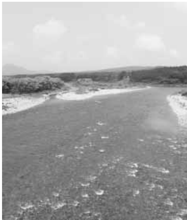
地域別の寄附状況

「ご寄附をいただいた皆様の気持ちを無駄にせず、有効に活用させていただきます。これからも関川村がたくさんの人たちに愛される村でいられるよう頑張っていきますので今後とも関川村に対するご支援をよろしくお願いいたします。」