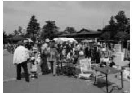
大勢の出店者でにぎわった昨年の様子

と き 5月17日(月)9時15分~17時 9時15分に歴史館集合 内 容 大川(府屋)の山城 定員 20名 参加費 無料 持ち物 昼食・水・雨具 申込締切 5月14日(木) 申し込み 歴史館 ☎ 64- 1288