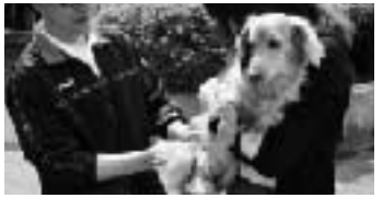
【日程表】都合のよい会場へお越しください

登録(生涯一度きり)...登録していない生後91日以上のすべての犬 注射(年に1回)...生後91日以上のすべての犬 料金(額につき) ▷登録料3,000円 ▷注射料3,100円 持ってくるもの ▷料金 ▷ハガキ(5月1日広報と一緒に配布。問診表に必要な事項を記入のうえ、押印してきてください) ▷登録していない犬...犬の種類、生年月日、毛色、性別、呼び名を記入したメモ 注意事項 注射会場には、車で移動しますので時間のずれが生じることがありますがご了承ください 犬が死亡したときは届出が必要です。建設環境課が注射会場にお越しください 参考(集合注射以外の料金) ▷獣医師宅 額 4,100円 ▷訪問注射 額 5,000円