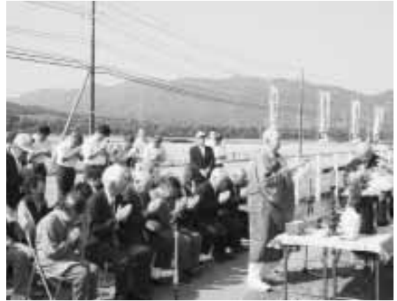
交通安全を祈願する参加者の皆さん

九月二十四日、秋の交通安全運動にあわせ、交通安全協会関川支部主催の「安全祈願祭」が打上の交通安全地蔵尊で行われました。 当日は、関係者や地元住民