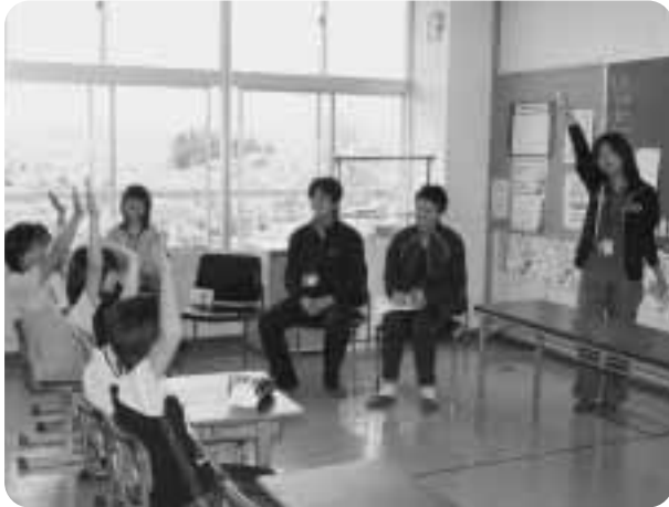
3年から6年生児童を対象に授業が行われ、夢を語りながら交流を図りました。

六月一日から五日までの五日間、平成二十一年度に入省した国家公務員の若手官僚が関川村を訪れました。 これは、国家公務員が入省する際の「初任行政研修」の一環で、地方自治体の実情を学ぼうと行われていて、昨年からは村が受け入れているもの。今回の研修に訪れたのは、法務、総務、農林水産、防衛省の研修生四人。高齢者のお宅訪問や林道整備、農作業などを行い、地方自治体の職員ならではの仕事を体験しました。 六月二日は、児童たちの職業観を育て、夢を持ってもら