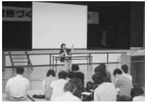
6月5日に開催された、健康づくり推進員のつどいで行われた、認知症サポーター養成講座のようす。