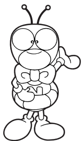
国民年金マスコット ゆめありくん