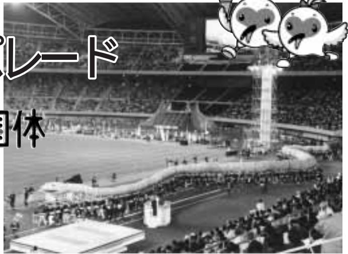
写真は、2001年4月のビッグスワンでのパレードのようす