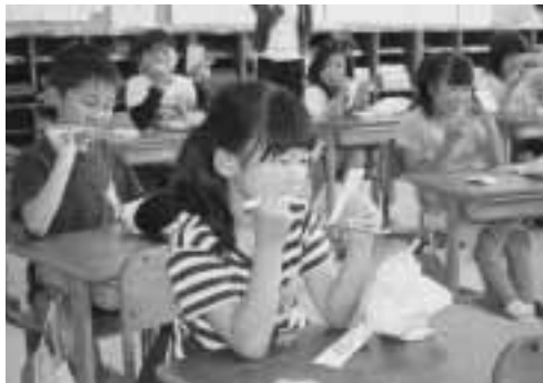
▶鏡をよく見ながら、歯磨きを行いましょう。