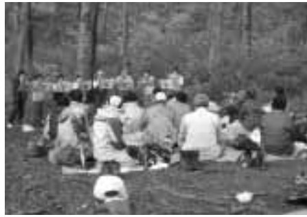
月夜平でのハーモニカ演奏会

ボランティアの皆さんによるハーモニカのコンサートも行われ、参加者は、豊かな自然の中で心身ともにリフレッシュしていました。