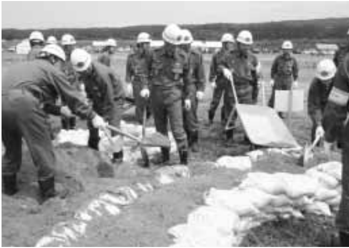
堤防の決壊を未然に防ぐ、「月の輪工」に本番さながらで取り組む、関川村消防団員の皆さん。