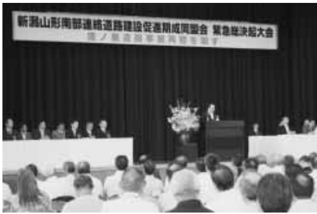
鷹ノ巣道路の事業の必要性について、参加者が一丸となって訴えました。

「できない」と、あいさつ。また、沿線市町村の住民四人が連絡道路の必要性について意見を発表しました。