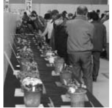
2006年3月、三条市で行われた雪割草展示会のようす