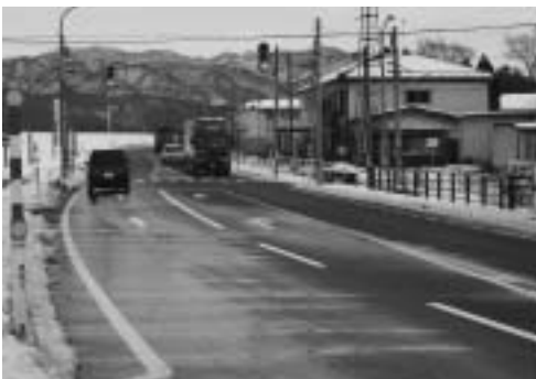
交通事故多発地点(国道113号線・大島地内)に右折レーンが整備されました。

交通事故は、交通ルールを守ることとゆずり合いのやさしい気持ちで減らすことができます。ドライバーも歩行者も一人ひとりが交通安全に努めましょう。