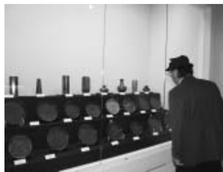
2008 大分国体での集火イベント

「炬火」とはたいまつのこと、オリンピックの聖火リレーなどのトーチのこと。この炬火の元となる火を採取することを採火といひます。