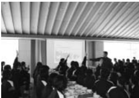
関川中学校ランチルームでの講座

一月二十一日には、関川中学校の全校生徒を対象に、クイズ形式で問題を出題。生徒たちは、当日の給食で使われている関川産食材の種類や生産量といった地産地消や、ジュースに入っている砂糖の量などの食生活の知識について学びました。