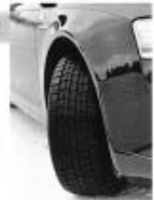
スタッドレスタイヤは雪上や氷上だけでなく、凍結した路面でも走ることができるので、雪が降る前に早めに交換しておこう。