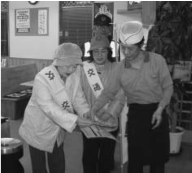
交通安全協会関川支部女性部、下関交番、上野新駐在所では毎年、冬の交通事故防止運動にあわせて村内の飲食店を巡回。飲酒運転根絶のリーフレットやポスターを配布し、飲酒運転根絶を呼びかけています。 (写真は昨年行われた巡回のようす)

一人ひとりが交通ルールを守り、正しい交通マナーを実践して事故を起こさないよう、遭わないようにしましょう。