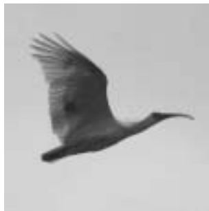
関川村を飛ぶトキ

佐渡市の放鳥場所から関川村までは海を渡って約100km。本州で野生状態のトキが確認されたのは、1970年(昭和45年)に石川県能登半島で捕獲されて以来38年ぶりとのことです。