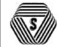
厚生労働大臣認可