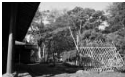
東桂苑もおすすめスポットです