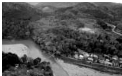
鷹の巣展望台から眺めは格別

関川村の鷹の巣から山形の県境までの約20km間は「荒川峡もみじライン」と呼ばれ紅葉スポットとして有名です。渡邊邸・東桂苑・丸山大橋・大石ダムなどもおすすめ紅葉スポットです。秋のひとつとき紅葉狩りに出かけてみてはいかがでしょうか。