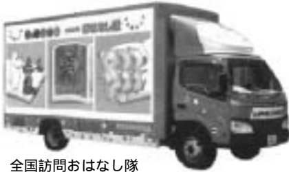
全国訪問おはなし隊 キャラバンカー