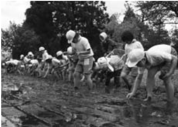
川北小学校学校田での田植え