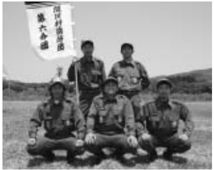
小型ポンプの部優勝 第六分団選手