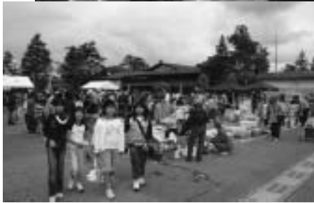
出店者も年々増えていて、品揃えも豊富なフリーマーケット広場。