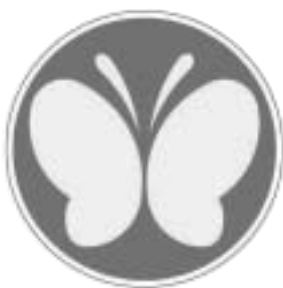
聴覚障害者マーク