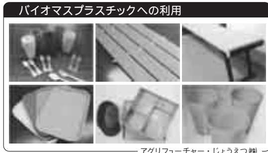
バイオマスプラスタックへの利用