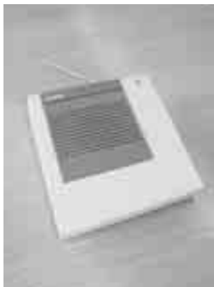
設置から20年以上経過する戸別受信機

問 石綿管更新等工事の場所は。 答 上関集落センター脇から八百七十六メートル先の旧水道施設あたりまでです。