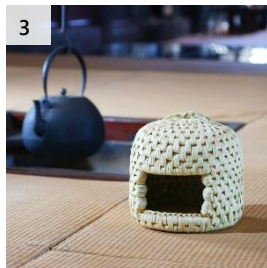
3 伝統民芸品 猫ちぐら (ミニ) 寄付額 90,000 円