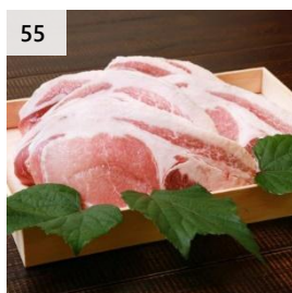
55 越後もち豚肩ロース肉 900g (とんかつ用) 寄付額 13,000 円～