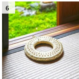
6 稲わらで編みこんだ 鍋敷き 寄付額 13,000 円～