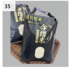
35 J A 北新潟 コシヒカリ 今摺米 5kg (5kg×1 袋) 寄付額 21,000 円～