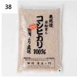
38 奥越後の百姓屋 こしひかり 玄米 3kg (3kg×1 袋) 寄付額 10,000 円～