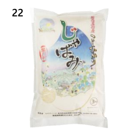
22 山口ファームのお米 こしひかり 6kg(3kg×2 袋) 「じゃばみ」 寄付額 18,000 円～