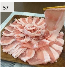
57 じゃばみ豚肩ロース肉 900g (しゃぶしゃぶ用) 寄付額 13,000 円～