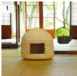
1 伝統民芸品 猫ちぐら (大) ・マット 2 枚付き 寄付額 150,000 円