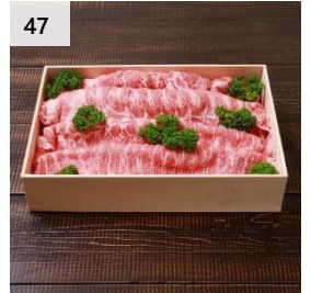
47 越後もち豚肩ロース肉 900g (しゃぶしゃぶ用) 小分けタイプ 寄付額 13,000 円～