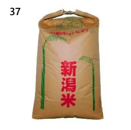
37 青南総合農園 こしひかり 玄米 30kg (30kg×1 袋) 寄付額 80,000 円～