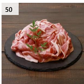
50 越後もち豚肩ロース肉 900g (すきやき用) 寄付額 13,000 円～