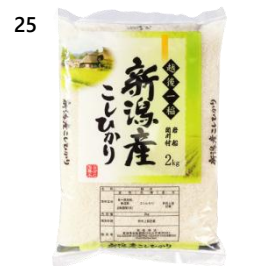
25 用助商店のお米 こしひかり 6kg (2kg×3 袋) 寄付額 20,000 円～