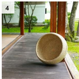
4 伝統民芸品 猫ちぐらお椀型・マット 2 枚付き 寄付額 130,000 円～