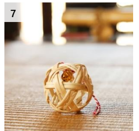
7 またたびで編みこんだ 「猫じゃらし」 寄付額 5,000 円～