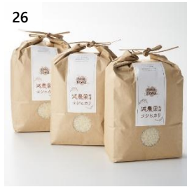
26 農家民宿おくやまのお米 こしひかり 6kg (2kg×3 袋) 寄付額 20,000 円～