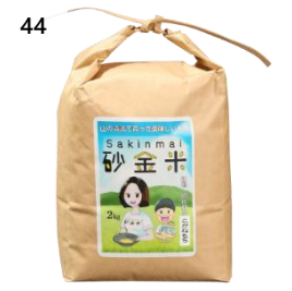
44 砂金米 こがねもち 2kg (2kg×1 袋) 寄付額 9,000 円～