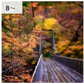
8～ えちごせきかわ温泉宿泊利用券 寄付額 10,000 円～