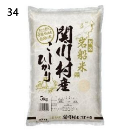
34 星山米店 こしひかり 5kg (5kg×1 袋) 寄付額 15,000 円～