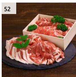
52 越後もち豚肩ロース肉 900g (しゃぶしゃぶ用 500g&すきやき用 400g) 寄付額 13,000 円～