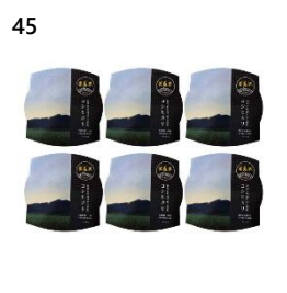
45 光兔米レンジアップごはん (150g×6 個) 寄付額 8,000 円～