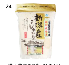
24 横山農産のお米 こしひかり 6kg (2kg×3 袋) 寄付額 19,000 円～