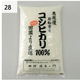
28 奥越後の百姓屋 こしひかり 3kg (3kg×1 袋) 寄付額 11,000 円～