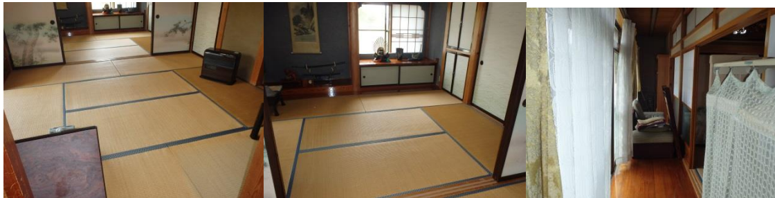
座敷 8 帖