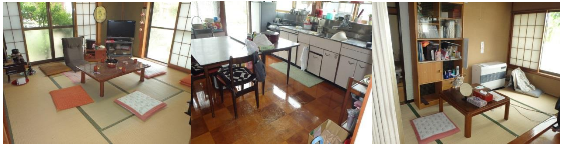
居間 8 帖