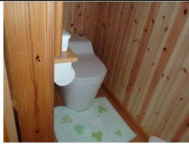
トイレ (リフォーム済み)