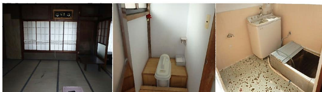
和室 10 帖