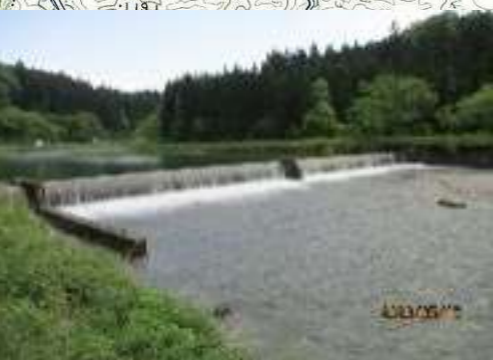
大石川：安角頭首工 他 ※水位が非常に深い。 大石川には、頭首工が多いため注意!