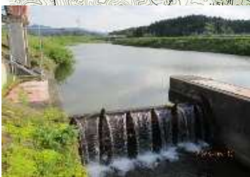
鎌江沢川：上土沢頭首工 ※水位が非常に深い。