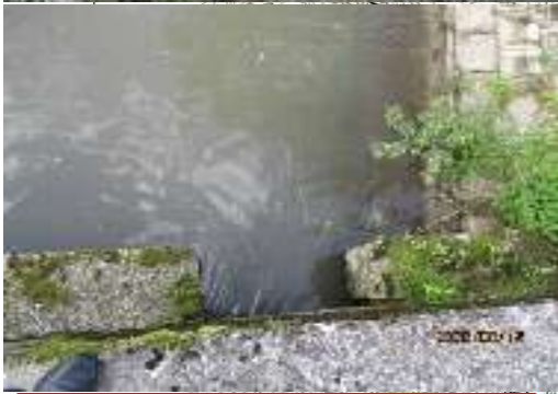
女川：高田頭首工 (左岸取入口) ※人が吸込まれる恐れがある。