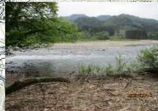
荒川：鷹ノ巣第一キャンプ場 ※川岸付近は浅く、流れも緩やかだが急に深くなり急流に巻き込まれる恐れがある。