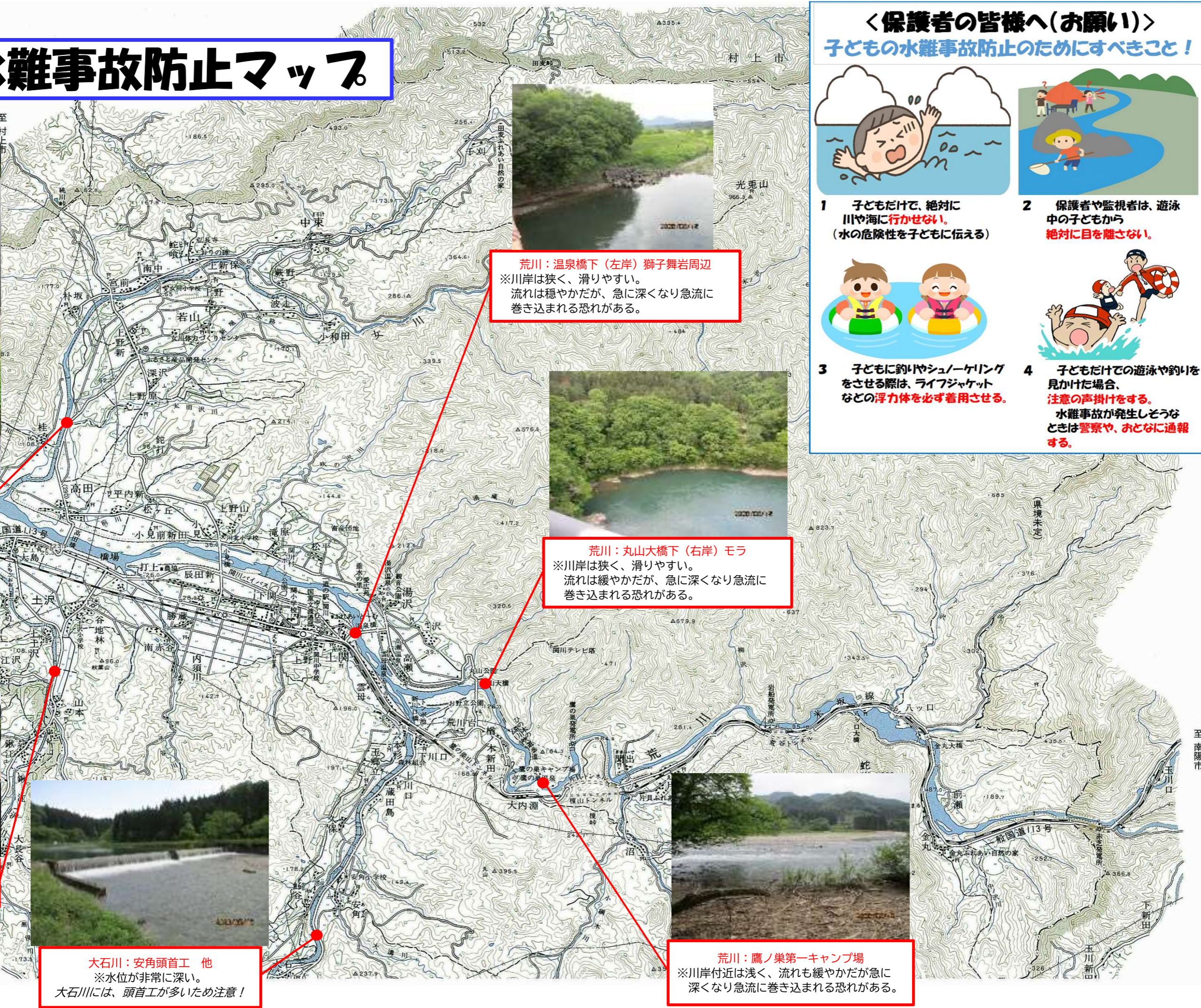
荒川：温泉橋下 (左岸) 獅子舞岩周辺 ※川岸は狭く、滑りやすい。 流れは穏やかだが、急に深くなり急流に巻き込まれる恐れがある。