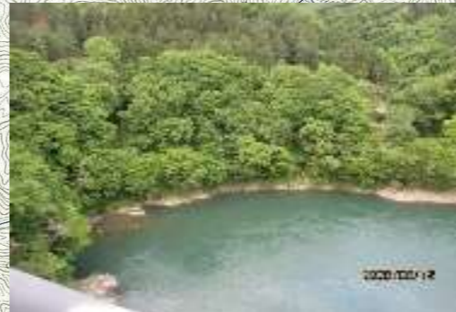
荒川：丸山大橋下 (右岸) モラ ※川岸は狭く、滑りやすい。 流れは緩やかだが、急に深くなり急流に巻き込まれる恐れがある。