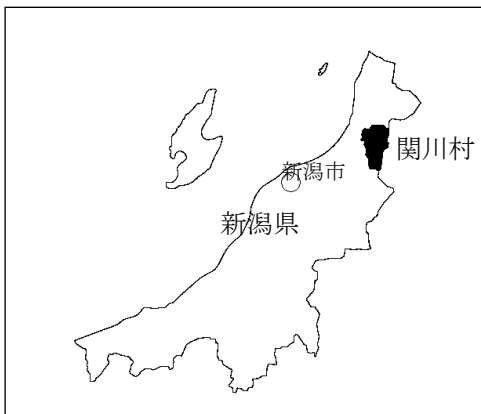
第 1 図表 関川村の位置