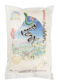
山口ファームのお米 こしひかり 6kg (3kg×2 袋) 「じゃばみ」 寄付額 10,000 円～