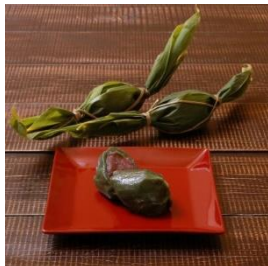
手作り笹団子 (20個) 寄付額 9,000 円～