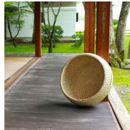
伝統民芸品 猫ちぐらお椀型・マット 2 枚付き 寄付額 130,000 円～