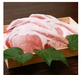
越後もち豚ロース肉 1kg (とんかつ用) 寄付額 11,000 円～