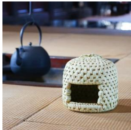
伝統民芸品 猫ちぐら (ミニ) 寄付額 90,000 円