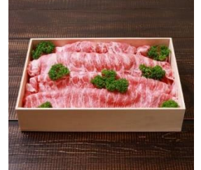
越後もち豚肩ロース肉 1.1kg (しゃぶしゃぶ用) 寄付額 11,000 円～