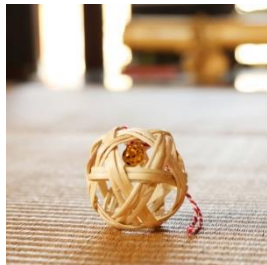
またたびで編みこんだ 「猫じゃらし」 寄付額 5,000 円～