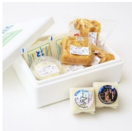
山口ファームの手作りとうふ &厚揚げセット 寄付額 15,000 円～