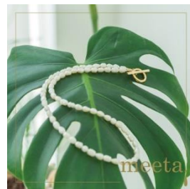
ライス淡水パールショートのネック レス (マンテル金具)×1点 寄付額 25,000 円～