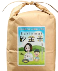
砂金米 こしひかり 6kg (2kg×3 袋) 寄付額 10,000 円～