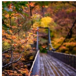
えちごせきかわ温泉宿泊利用券 寄付額 10,000 円～