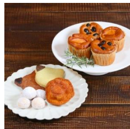
焼き菓子セット 寄付額 5,000 円～