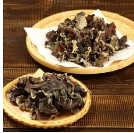
あらかわキクラゲ 乾燥セット 寄付額 18,000 円～