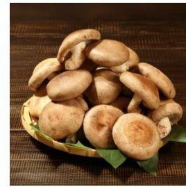
あらかわ生しいたけ特選 特大プレミアム (1.2kg) 寄付額 10,000 円～