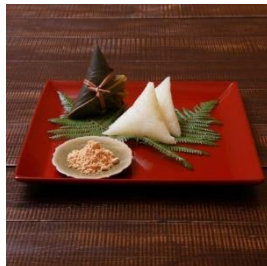
手作り笹巻き (20個) 寄付額 8,000 円～