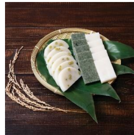
きねつき光兔もち (白もち36枚または、白・草・豆もち各12枚) 寄付額 9,000 円～