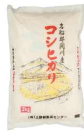
上野新農業センターのお米 関川村産コシヒカリ 6kg (2kg×3 袋) 寄付額 10,000 円～