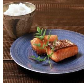
鮭の味噌漬け (6切れ) & コシヒカリ (4kg) 寄付額 15,000 円～