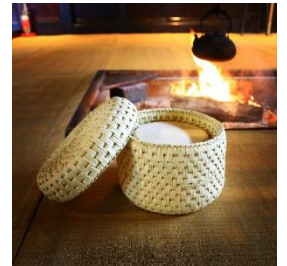
伝統民芸品 おひつ入れ・おひつセット (3 合用) 寄付額 200,000 円～