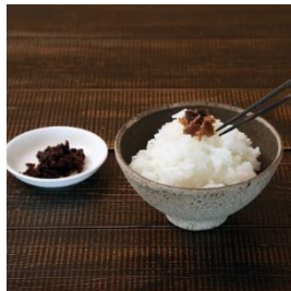
刻み味噌漬け & しいたけ味噌 (各2個) & コシヒカリ (2kg) 寄付額 8,000 円～