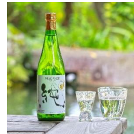
♫張鶴 純 720ml×2本、1800ml 寄付額 15,000 円～