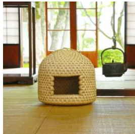
伝統民芸品 猫ちぐら (大) ・マット 2 枚付き 寄付額 150,000 円