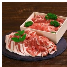
越後もち豚肩ロース肉 1.1kg (しゃぶしゃぶ用 550g&すき焼き用 550g) 寄付額 11,000 円～