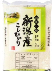
用助商店のお米 こしひかり 6kg (2kg×3 袋) 寄付額 10,000 円～