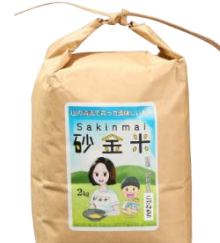
砂金米 こがねもち 2kg (2kg×1 袋) 寄付額 5,000 円～