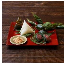
笹団子 (10個) & 笹巻き (10個) セット 寄付額 9,000 円～