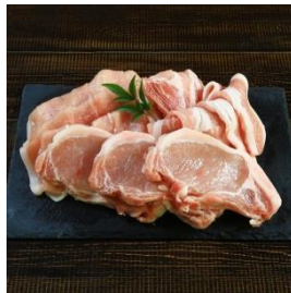
朝日豚ロース3品セット (しゃぶしゃぶ用 300g、スライス300g、とんかつ用 400g) 寄付額 11,000 円～