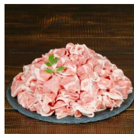
朝日豚肩ロース 2.2kg (しゃぶしゃぶ用) 寄付額 21,000 円～