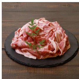
越後もち豚肩ロース肉 1.1kg (すき焼き用) 寄付額 11,000 円～