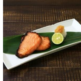
鮭の味噌漬けセット (味噌漬け2切れ×3袋) 寄付額 17,000 円～