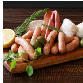
女川ハム工房の ハム&ソーセージセット 寄付額 11,000 円～