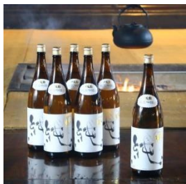
♫張鶴 純 1800ml×6本 寄付額 80,000 円～