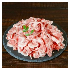
朝日豚肩ロース 1.1kg (しゃぶしゃぶ用) 寄付額 11,000 円～