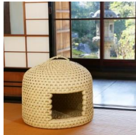
伝統民芸品 猫ちぐら (特大) ・マット 2 枚付き 寄付額 200,000 円