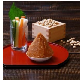
旬づくり味噌 (1kg×3個) 寄付額 10,000 円～