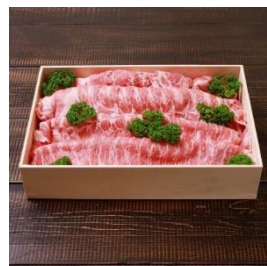
越後もち豚ロース肉 1kg (しゃぶしゃぶ用) 寄付額 11,000 円～