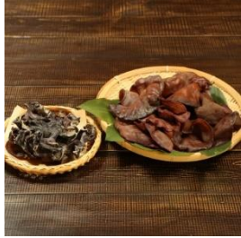
あらかわキクラゲ 生・乾燥セット 寄付額 10,000 円～