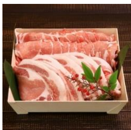
越後もち豚ロース肉 1kg (しゃぶしゃぶ用 500g&とんかつ用 500g) 寄付額 11,000 円～