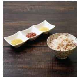
雑穀セット (3種) 寄付額 10,000 円～