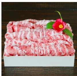
越後もち豚肩ロース肉 2.2kg (しゃぶしゃぶ用) 寄付額 21,000 円～