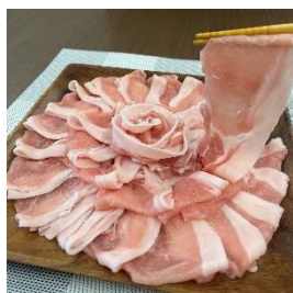
じゃばみ豚ロース肉 1kg (しゃぶしゃぶ用) 寄付額 11,000 円～