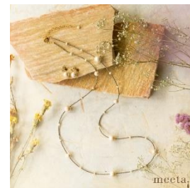
ケブラーセット (ロングネックレスと イヤリングまたはチタンピアス) 寄付額 25,000 円～