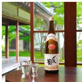
♫張鶴 雪 720ml×2本、1800ml 寄付額 11,000 円～