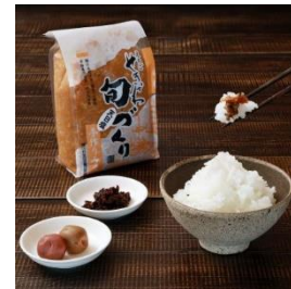
おふくろ味セット & コシヒカリ (2kg) 寄付額 10,000 円～