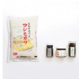
とんから & とん辛酢 & 行者にんにく 醤油仕込み & コシヒカリ (2kg) 寄付額 10,000 円