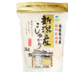
横山農産のお米 こしひかり 6kg (2kg×3 袋) 寄付額 10,000 円～