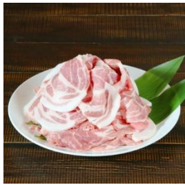
朝日豚肩ロース肉 1.1kg (焼肉用) 寄付額 11,000 円～