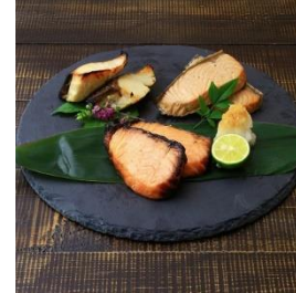
鮭と銀ひらすセット (味噌漬け、焼き漬け、銀ひらす塩麹漬け各1袋) 寄付額 16,000 円～