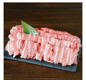
朝日豚バラ肉 1.2kg (しゃぶしゃぶ用) 寄付額 11,000 円～