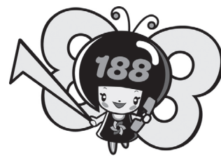
消費者庁消費者ホットライン188 イメージキャラクターいやや

困ったときは、消費者ホットライン『いやや』(局番なしの188)までお電話ください。