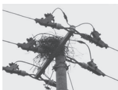
カラスの営巣の様子

3月中旬から6月上旬は、カラスの単作時期となります。電線付近での営巣は、停電の原因にもなっていますので、電柱にカラスの巣を発見した場合は、情報提供をお願いします。