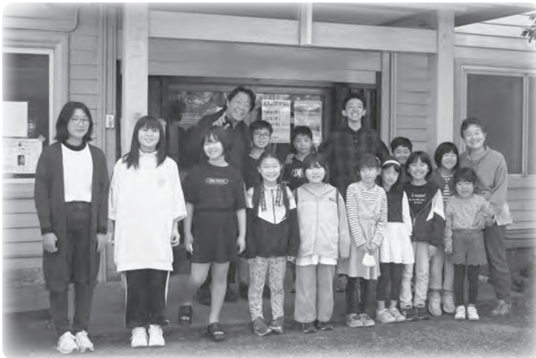
▲PR動画に出演した子どもたち。監督・出演者を囲んで。