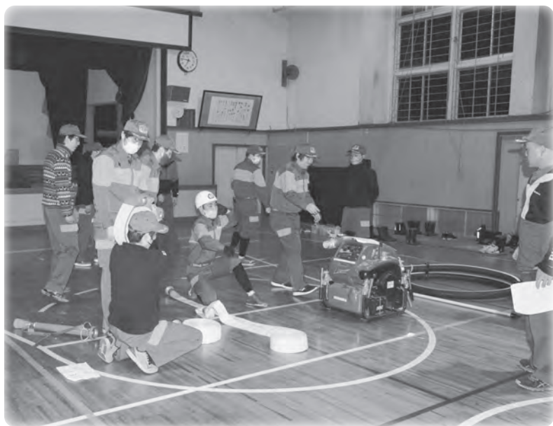
▲5月21日開催のポンプ操法競技会に向け練習する消防団。競技会では、ポンプ始動から放水までに要する時間や、規律などを競います。