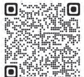
動画の感想をお寄せください

Youtubeで公開されています。動画制作は、村の地域政策課がテレビCM等の映像作品を制作している専門業者に依頼したもの。オノマトペとは、動画に登場する旧斎藤医院を店舗とした架空のパン屋の名称。旧斎藤医院には宮沢賢治が訪れた記録があることから、宮沢賢治の作品の特徴であるオノマトペ（擬音語と擬態語をまとめた言い方）から引用したものです。