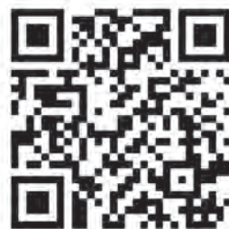
動画はこちらから