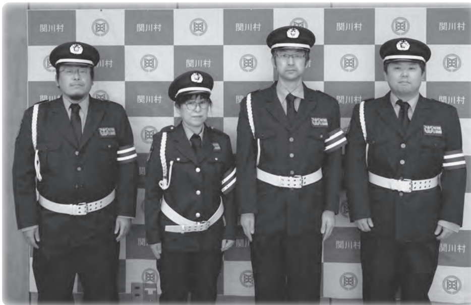
交通安全指導員の皆さん（敬称略）

関川村の皆さまの安全と安心を守っていただけるよう精一杯頑張りますので、よろしくお願い致します。