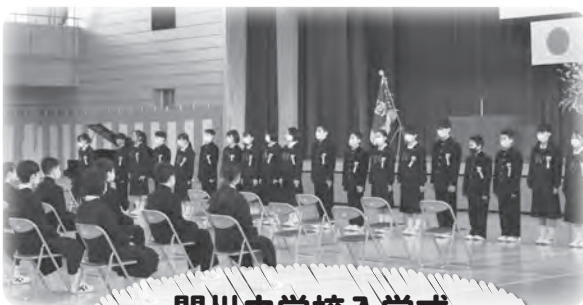
関川中学校入学式