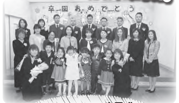
大島保育園 卒園式 入園式