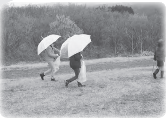
▲ 荒川クリーン作戦 雨の中ゴミ拾いに出発する子どもたち