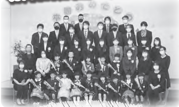
下関保育園 卒園式 入園式