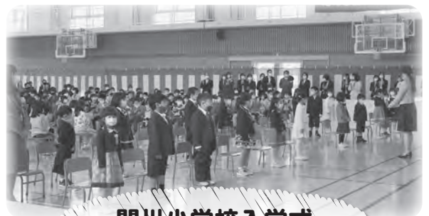
関川小学校入学式