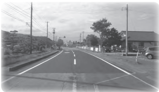
工事後の村道橋場下関線（下関保育園付近）

この交付金を活用し、今年度は傷みが激しかった村道橋場下関線の補修工事を行いました。