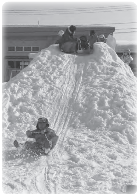
▲下関保育園のすべり台 早速次の日「もう1回！」と何度もすべり台を楽しむ子どもたち