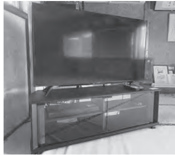
▲テレビ、テレビ台、 ブルーレイディスク レコーダー