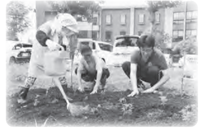
▲ケアハウスせきかわ

ケアハウスせきかわとむつみ荘では、8月11日、「オレンジガーデニングプロジェクト」の一環としてオ