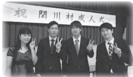
▲ 昨年の実行委員の皆さん

※成人式の開催や実行委員の活動については、新型コロナウイルス感染症の状況によって変更となる場合があります。