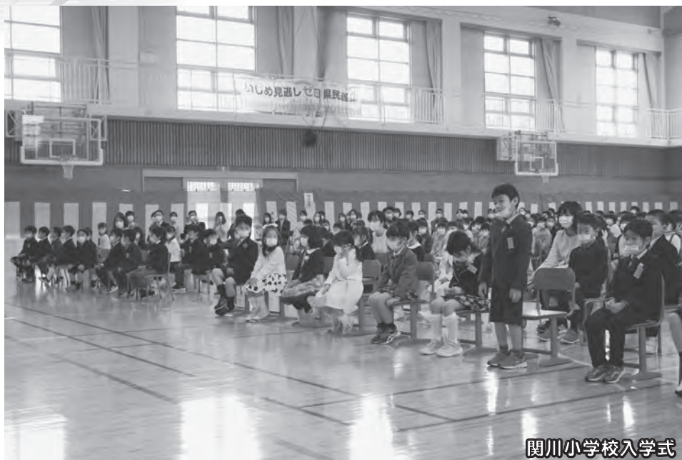
関川小学校入学式