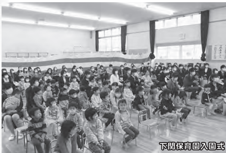
下関保育園入園式