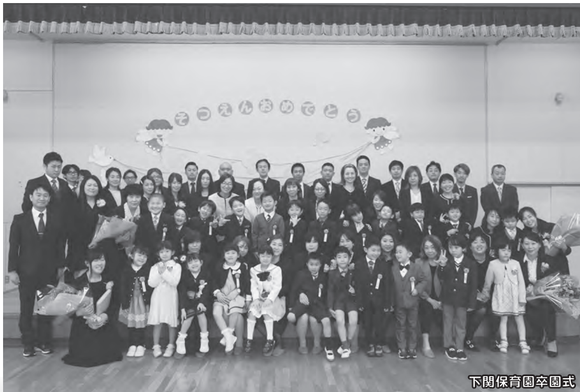
下関保育園卒園式