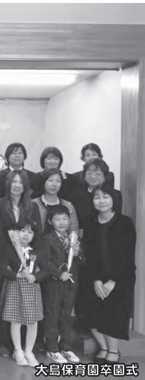
大島保育園卒園式