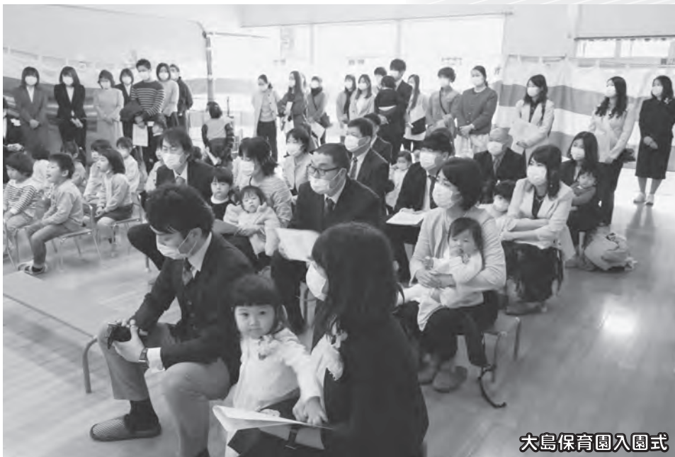
大島保育園入園式

新型コロナウイルスの感染予防のため、規模を縮小して式が の距離が近くなり、思わず笑顔や涙するシーンが見られ、