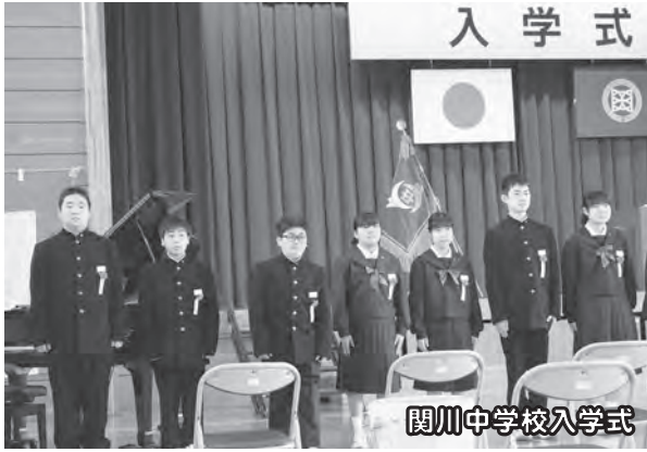
関川中学校入学式