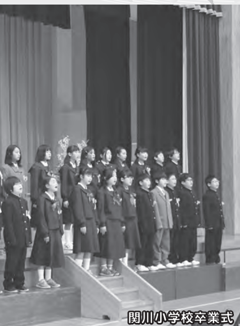
関川小学校卒業式