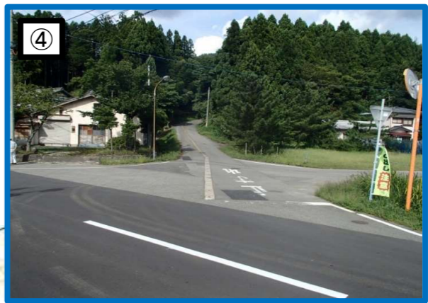
県道に取り付く変則交差点の優先路が不明確で危険