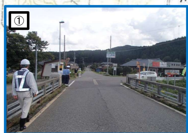
スクールバスの待合所にいる子供たちが橋の高欄により見えづらい