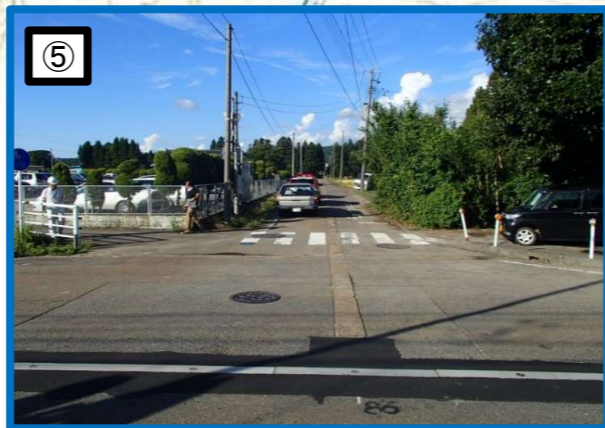
歩道のない通学路に通勤車両が進入する際危険