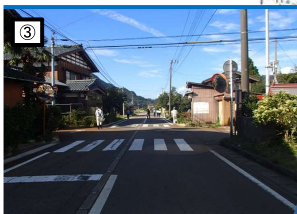
歩道がなく交通量も多く見通しが悪い