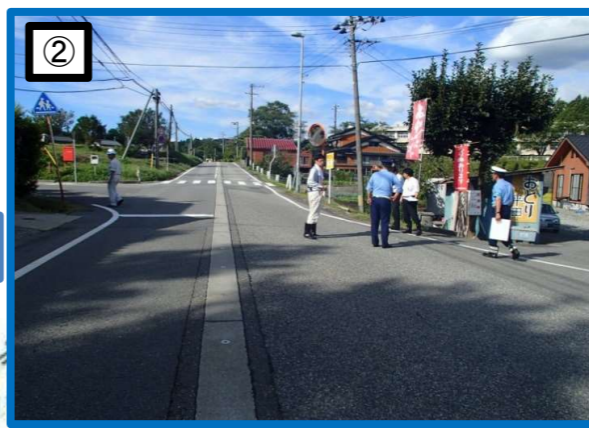
歩道がなく交通量も多く危険